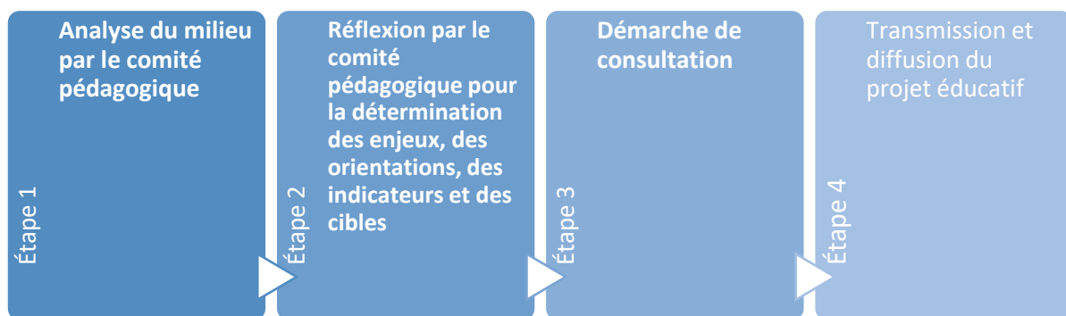
Figure 1 - Étapes de la démarche d'élaboration du projet éducatif 2023-2027

La démarche d'élaboration du projet éducatif 2023-2027 a été réalisée principalement en 4 étapes telles que présentées à la figure suivante :