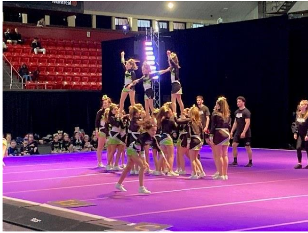
1 - Compétition de cheerleading