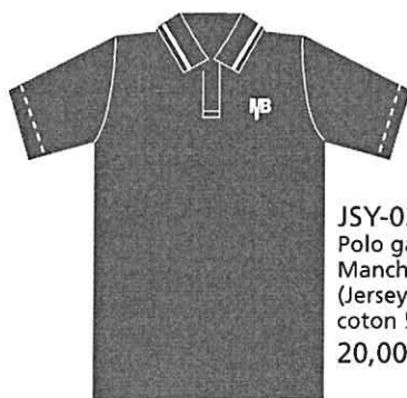
JSY-03-MB Polo garçon Manches courtes (Jersey poly- coton 50/50) 20,00 $