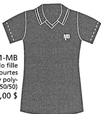
JSY-01-MB Polo fille Manches courtes (Jersey poly- coton 50/50) 20,00 $