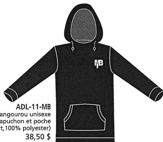
ADL-11-MB Kangourou unisexe capuchon et poche (Dry-fit, 100% polyester) 38,50 $