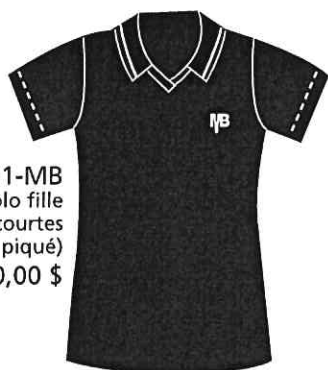
ADL-01-MB Polo fille Manches courtes (Tissu piqué) 20,00 $

UNIFORMES SCOLAIRES de fabrication 100 % québécoise