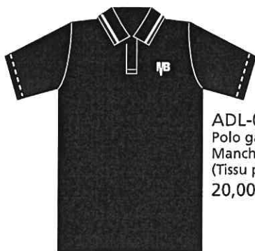
ADL-03-MB Polo garçon Manches courtes (Tissu piqué) 20,00 $