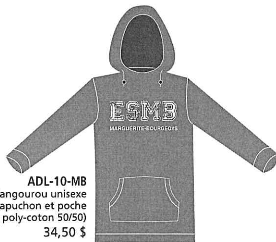
ADL-10-MB Kangourou unisexe capuchon et poche (Jersey poly-coton 50/50) 34,50 $