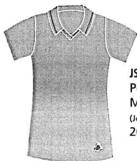
JSY-01-DRAB Polo fille Manches courtes (Jersey poly-coton 50/50) 20,00 $

UNIFORMES SCOLAIRES de fabrication 100 % québécoise