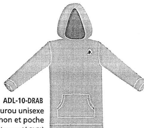
ADL-10-DRAB Kangourou unisexe capuchon et poche (coton ouaté 50/50) 31,00 $