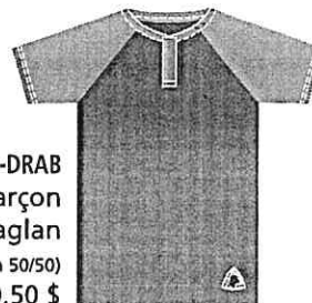
JSY-RG-01-DRAB Polo garçon Manche raglan (Jersey poly-coton 50/50) 20,50 $