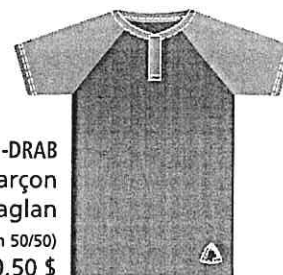
JSY-RG-01-DRAB Polo garçon Manche raglan (Jersey poly-coton 50/50) 20,50 $