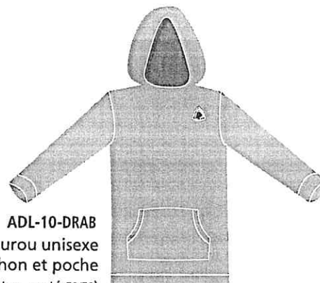
ADL-10-DRAB Kangourou unisexe capuchon et poche (coton ouaté 50/50) 31,00 $