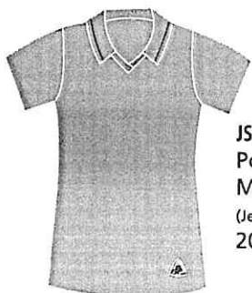
JSY-01-DRAB Polo fille Manches courtes (Jersey poly-coton 50/50) 20,00 $

UNIFORMES SCOLAIRES de fabrication 100 % québécoise