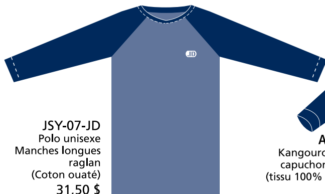
JSY-07-JD Polo unisexe Manches longues raglan (Coton ouaté) 31,50 $