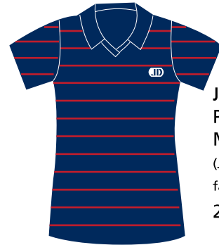
JSY-02-JD Polo fille Manches courtes (Jersey poly-coton 65/35) fabriqué au Québec 26,50 $