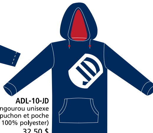
ADL-10-JD Kangourou unisexe capuchon et poche (tissu 100% polyester) 32,50 $