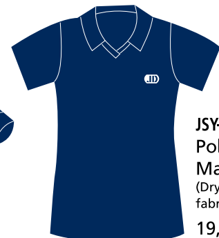
JSY-08-JD Polo fille Manches courtes (Dry-fit 100% polyester) fabriqué au Québec 19,50 $