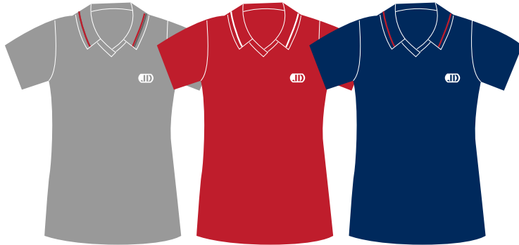
JSY-01-JD Polo fille Manches courtes (Jersey poly-coton 65/35) fabriqué au Québec 19,50 $

UNIFORMES SCOLAIRES de fabrication 100 % québécoise