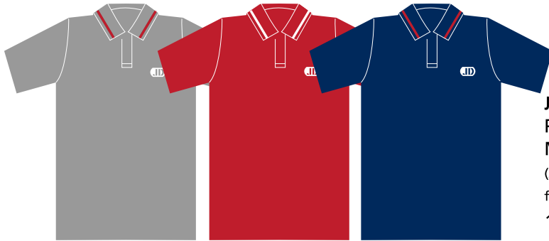
JSY-03-JD Polo garçon Manches courtes (Jersey poly-coton 65/35) fabriqué au Québec 19,50 $