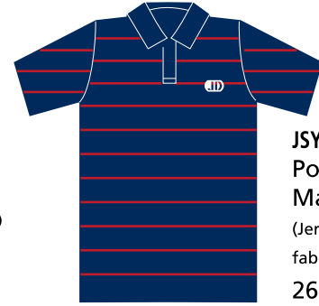
JSY-04-JD Polo garçon Manches courtes (Jersey poly-coton 65/35) fabriqué au Québec 26,50 $