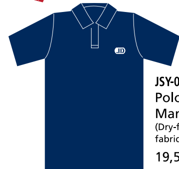
JSY-08-JD Polo garçon Manches courtes (Dry-fit 100% polyester) fabriqué au Québec 19,50 $